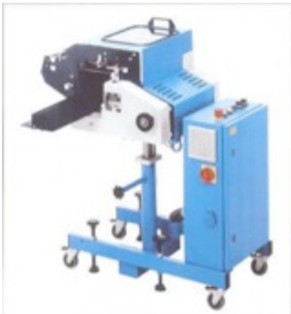
Plieuse à couteau EK 300 pour pli croisé.

Des plieuses automatiques combinées et des plieuses automatiques à poches pour des formats allant de 6 à 6,5 cm jusqu'à 74 à 104 cm - plus de 100 modèles disponibles. Dispositifs de publipostage de toutes sortes. Machines spéciales sur mesure en fonction du souhait du client. Interrogez-nous. Nous apporterons une solution à vos problèmes de pliage.