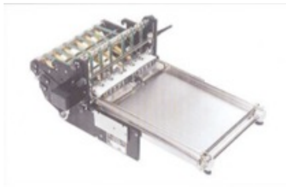
Sortie verticale KS 310 pour pli miniature.

Photo non contractuelle, sous réserve de modification - Tous droits réservés GUK et Couvertec France Cette documentation fait l'objet d'une protection du droit d'auteur. Sans notre autorisation écrite préalable, elle ne doit ni être modifiée ou dupliquée, ni transmise à des tiers, ni utilisée contrairement à nos intérêts légaux. Copyright by GUK - Griesser & Kunzmann Copyright by Couvertec France.