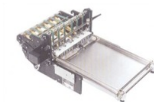
Sortie verticale KS 310 pour document miniature