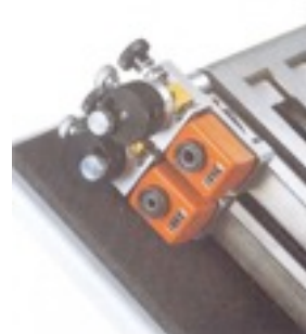
Nouvelles poches de pliage combinées avec indicateurs et aiguillages de déviation intégrés