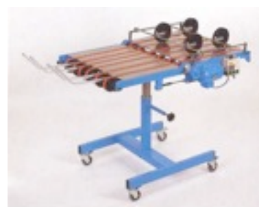
Accessoires en option : sortie en nappe mobile