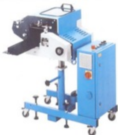
Plieuse à couteau EK 300 pour pli croisé