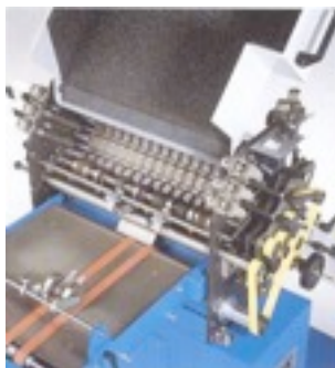
Entraînement de bande silencieux, à l'extérieur