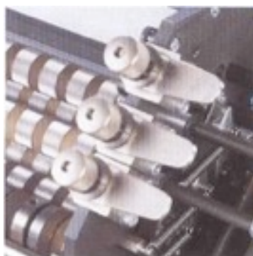
Réglage automatique des cylindres