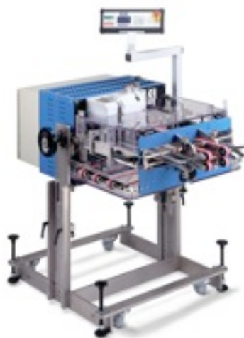
ZK 500...ZK 600 avec assistant M4

Photo non contractuelle, sous réserve de modification - Tous droits réservés GUK et Couverttec France Cette documentation fait l'objet d'une protection du droit d'auteur. Sans notre autorisation écrite préalable, elle ne doit ni être modifiée ou dupliquée, ni transmise à des tiers, ni utilisée contrairement à nos intérêts légaux. Copyright by GUK - Griesser & Kunzmann Copyright by Couverttec France.