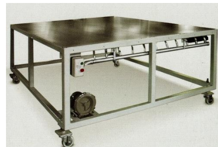
Table soufflante mobile + moteur soufflerie