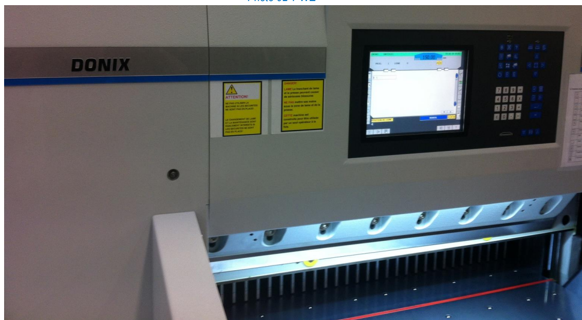
Changement de lame assisté avec dispositif de montage ultra-rapide (brevet Allemand)

Le double guidage de l'équerre sur deux crémaillères (droite et gauche) permet de supprimer le trou central sur la table arrière. Ceci évite la dépose de copeaux de papier sur la vis sans fin et supprime ainsi les réglages intempestifs de l'équerre. Le programme avec un écran tactile, comprend toutes les fonctions additionnelles permettant une meilleure productivité.