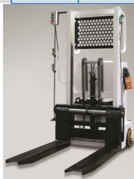
Elévateur mobile EME